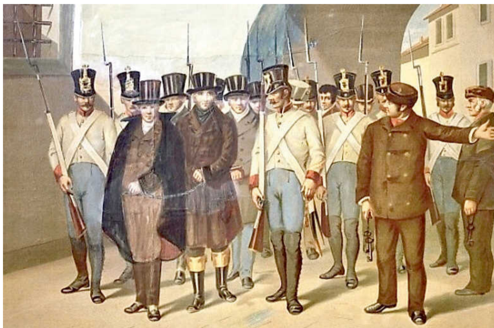
L'arresto di un gruppo di cospiratori della Carboneria in una stampa d'epoca

Di fronte all'implacabile giudice accusatore Paride Zajotti, che arrivò a spiare i deliri notturni in cella di Bianchi, malato da tempo, nella speranza di carpire qualche compromettente ammissione utile alle indagini, il giovane sacerdote, che aveva negato di far parte della "setta" mazziniana, cercò disperatamente di difendersi, riconoscendo di aver scritto un anno prima un saggio di natura politica, ma spiegando di averlo poi distrutto. La carcerazione, intanto, peggiorava le sue già precarie condizioni di salute, fino alla morte, avvenuta il 30 luglio 1834, ufficialmente per gastroenterite, ma con il sospetto del suicidio difficile da sviare. La salma venne sepolta in una fossa sen-