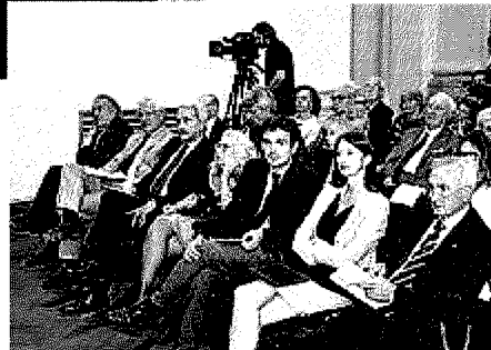
PLATEA A destra, le autorità presenti Sotto, i premiati con il rettore del Ghislieri e parte della giuria